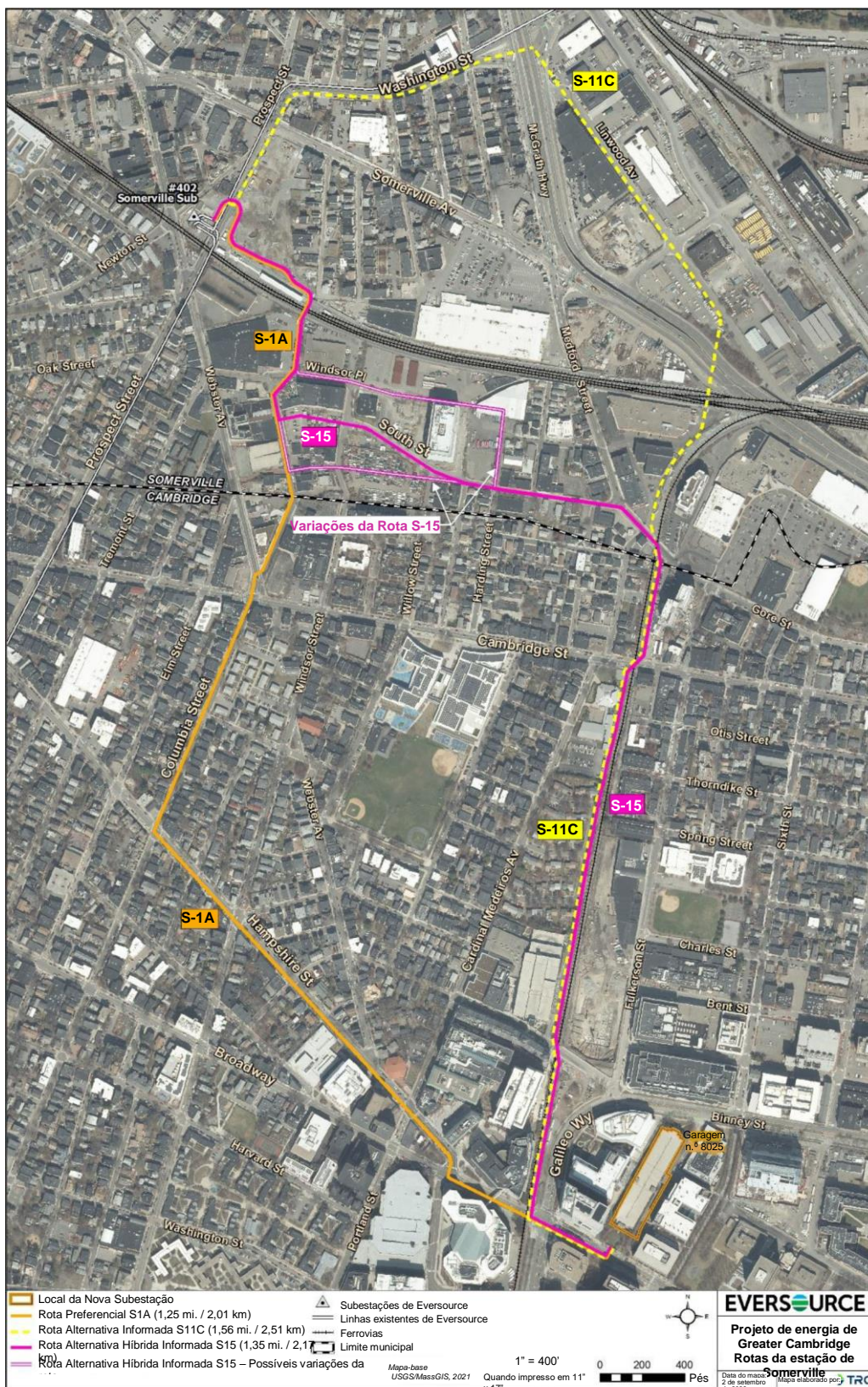
Figura 1: Área de estudo de Somerville