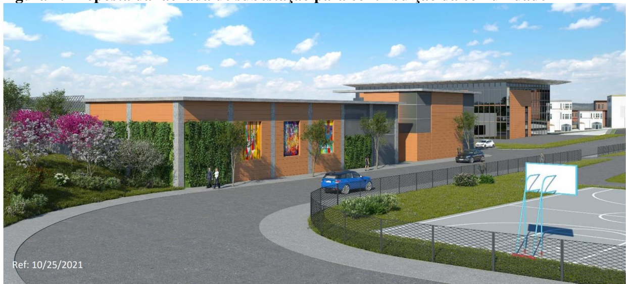
Figura 2: Proposta da fachada de subestação para contribuição da comunidade

Observação: Este é apenas um conceito de design. O design final será escolhido em colaboração com a comunidade e pode ser diferente.